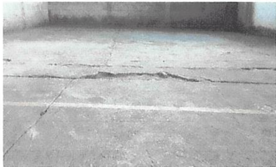
3: Reparacion de losa