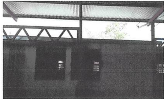
Foto 4: Cubierta de lamina estructura con ventilacion cambio de caída de agua